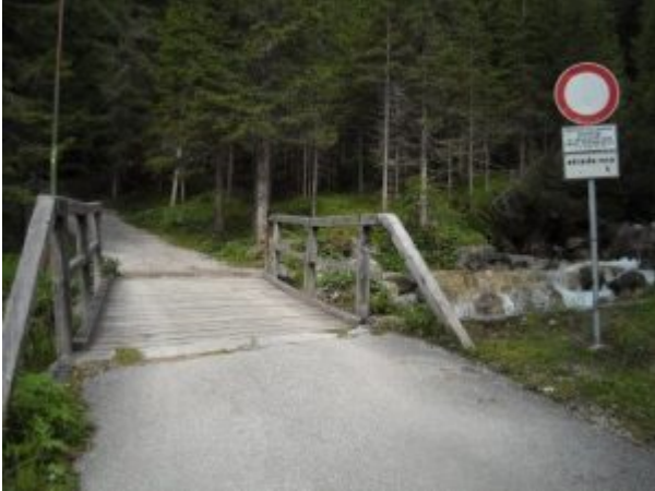
11:00 – polazak prema domu – Rif. O. Falier