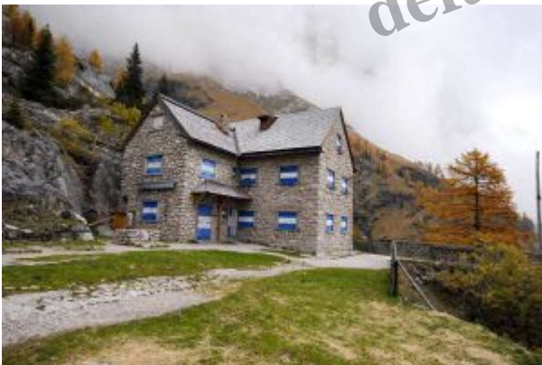
14:00 – dolazak u dom – smještaj